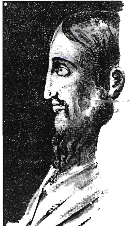
Fig. N. 2 - Frammento di un mosaico del III sec. con il profilo del Redentore. - Museo Vaticano -