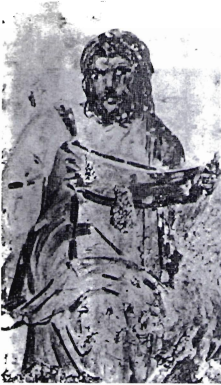
Fig. N. 1 - Il Cristo Docente - Affresco in Roma: Ipogeo degli Aureli - Inizio III secolo.